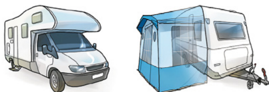
Exempel på campingfordon.

Det är ditt eget ansvar som campinggäst att se till att avstånden till dina grannar hålls.